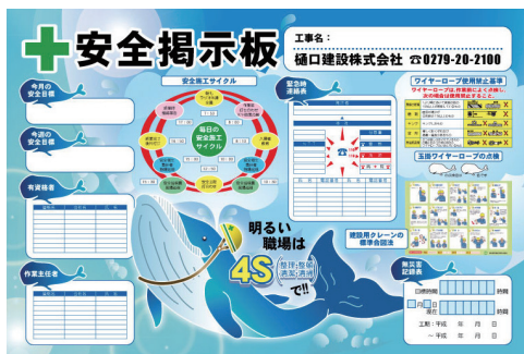
屋外安全掲示板 建設会社