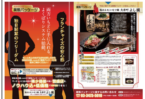
DM(表面 / 裏面)(プレゼン) 飲食店フランチャイズ