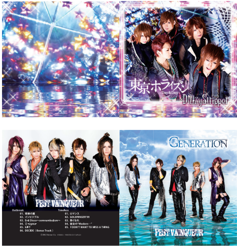
CDジャケット(ロゴ制作含む) V系アーティスト

1995年、武蔵野美術大学 短期大学部 デザイン科 空間演出デザイン専攻卒。 ローカルTVCMの製作を経、1997年～2009年まで出版社にて求人広告のDTP・イラストレーション・コピーライティング、フライヤー・ポスター・パンフレット・DM・WEBサイト・販促グッズ等を制作。 2009年～フリーランスとして活動。NHK教育TV「テストの花道」「Rの法則」「エデュカチオ！」フジテレビ「それマジ!? ニッポン」等のイラスト作画、声優ライブ衣装のテキスタイルデザイン、全国ネットTV番組の衣装パーツデザイン協力、V系ほかアーティストのCD/DVDジャケット・ポスター・雑誌広告・グッズ、企業の商品紹介漫画の作画、ロゴ・看板・Tシャツ・手ぬぐい、ほか、舞台美術・インスタレーションなど、多様なジャンルのデザインを手掛ける。